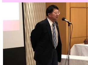
五十嵐副会長、閉会挨拶