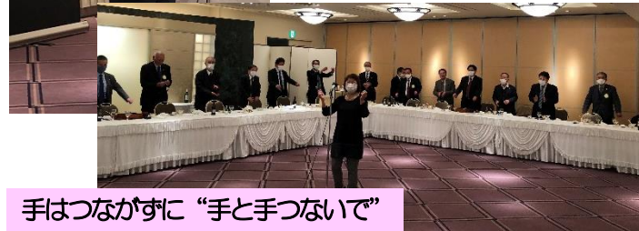
手はつながずに“手と手つないで”