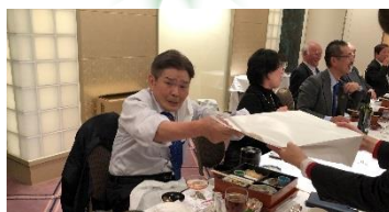
高額落札に感謝！勝山会員