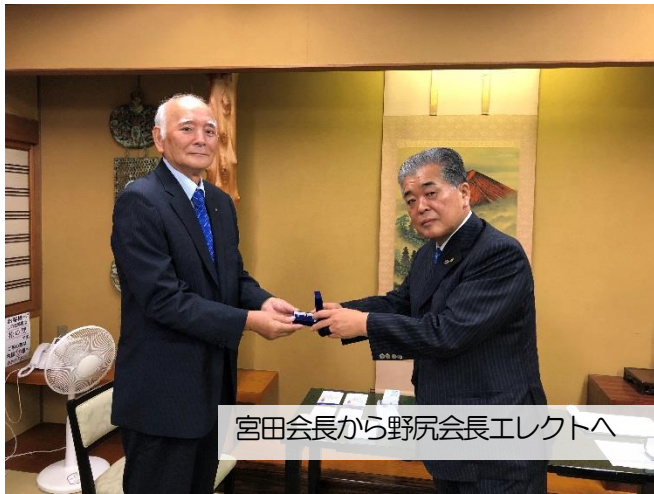
宮田会長から野尻会長エレクトへ