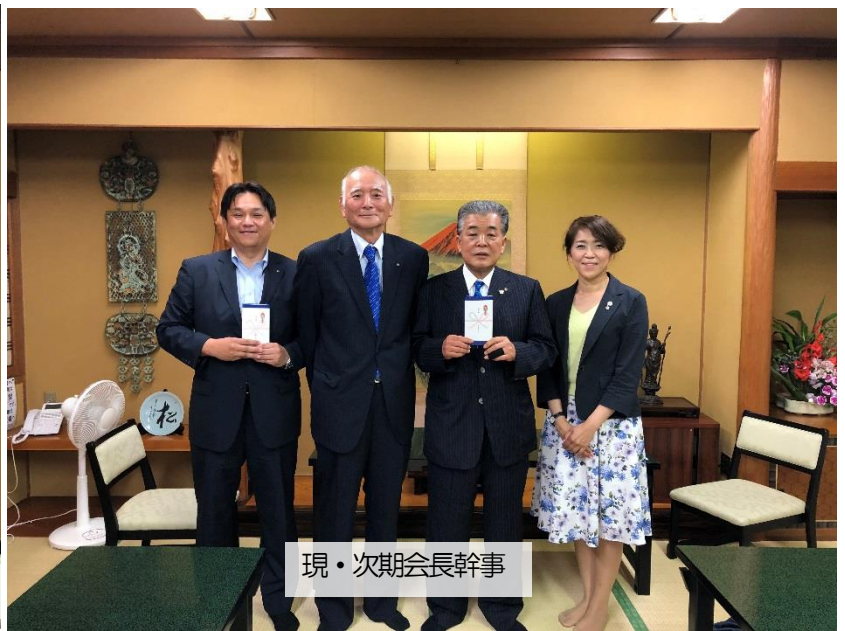
現・次期会長幹事