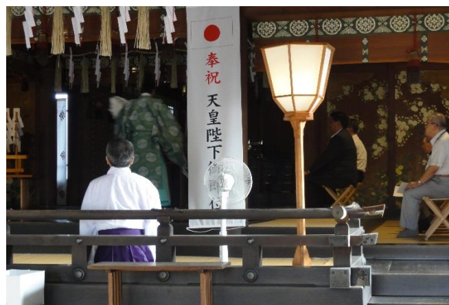
お祓いを受ける会員一同↑